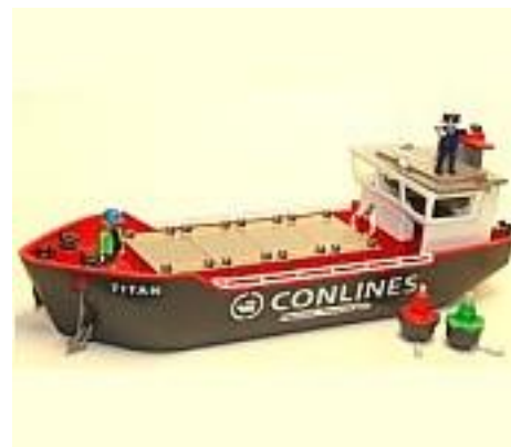
F210 Playmobil boot

Sommig speelgoed is populairder dan ander speelgoed. De meest uitgeleende items die we hebben staan in de tabel. Hierin staat met name kwalitatief goed speelgoed hoog in de lijst. Playmobil, Duplo, Haba spellen en muziekinstrumenten voeren de lijst aan.