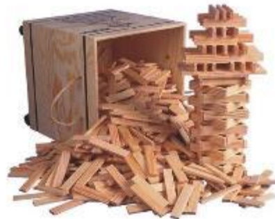
Nummer 4 en 6: Kapla bouw plankjes