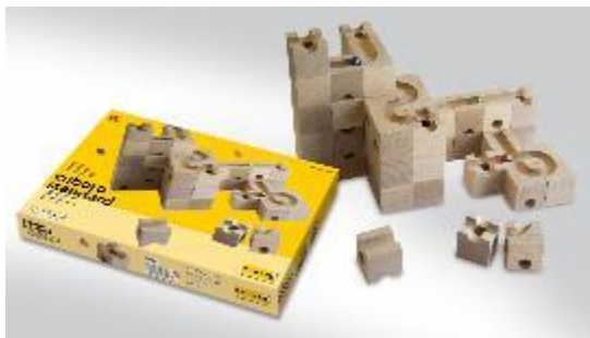
Nummer 12: Cuboro knikkerbanen