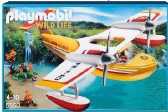
Nummer 1-3: Playmobil