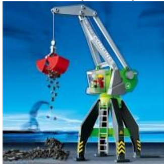
Nummer 1: Playmobil hijskraan