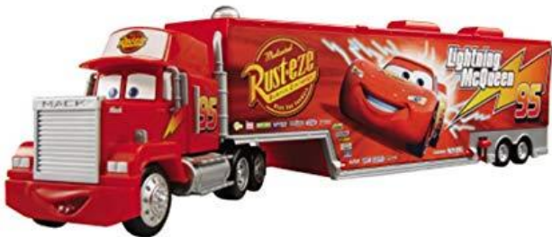
Nummer 3: Cars truck