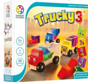
Nummer 2: Trucky 3